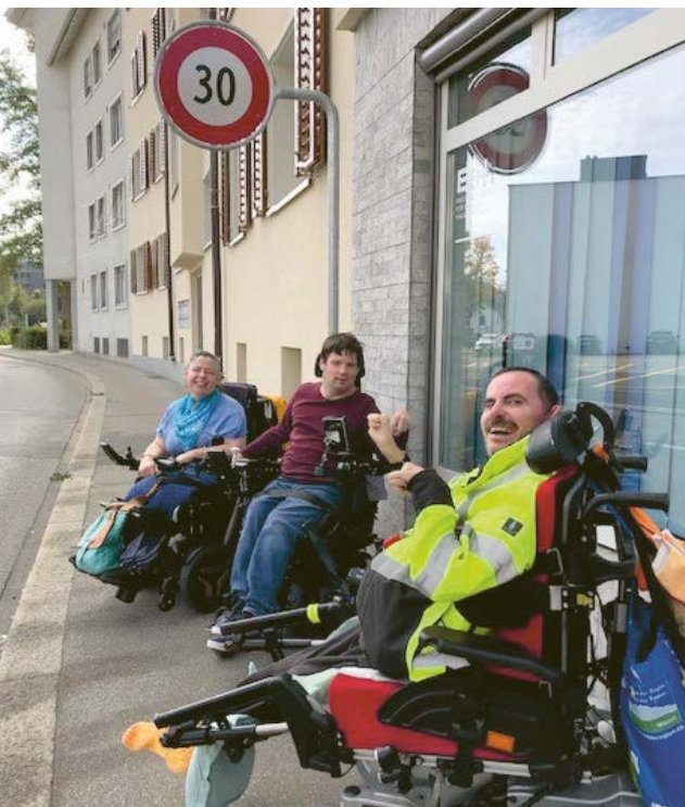
Die Mitglieder des Bewohner-Rats freuen sich über ihren Erfolg. Tempo 30 gilt nun auch im Abschnitt Fischerhäuserstrasse beim Lindli-Huus

Lindli-Huus Wohnhaus für Körperbehinderte Fischerhäuserstrasse 47 8200 Schaffhausen