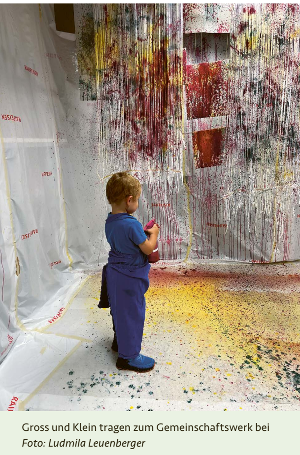
Gross und Klein tragen zum Gemeinschaftswerk bei

dabei herauskam. Für alle war es eine rundherum gelungene Museumsnacht, in der man mit vielen Menschen in Kontakt kam, die das Atelier am Rheinquai bisher noch nicht kennengelernt hatten.