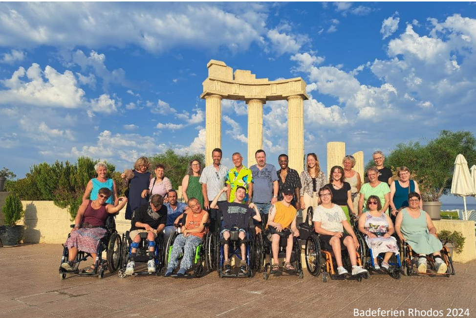
Badeferien Rhodos 2024

Vereinigung Cerebral Schweiz Association Cerebral Suisse Associazione Cerebral Svizzera